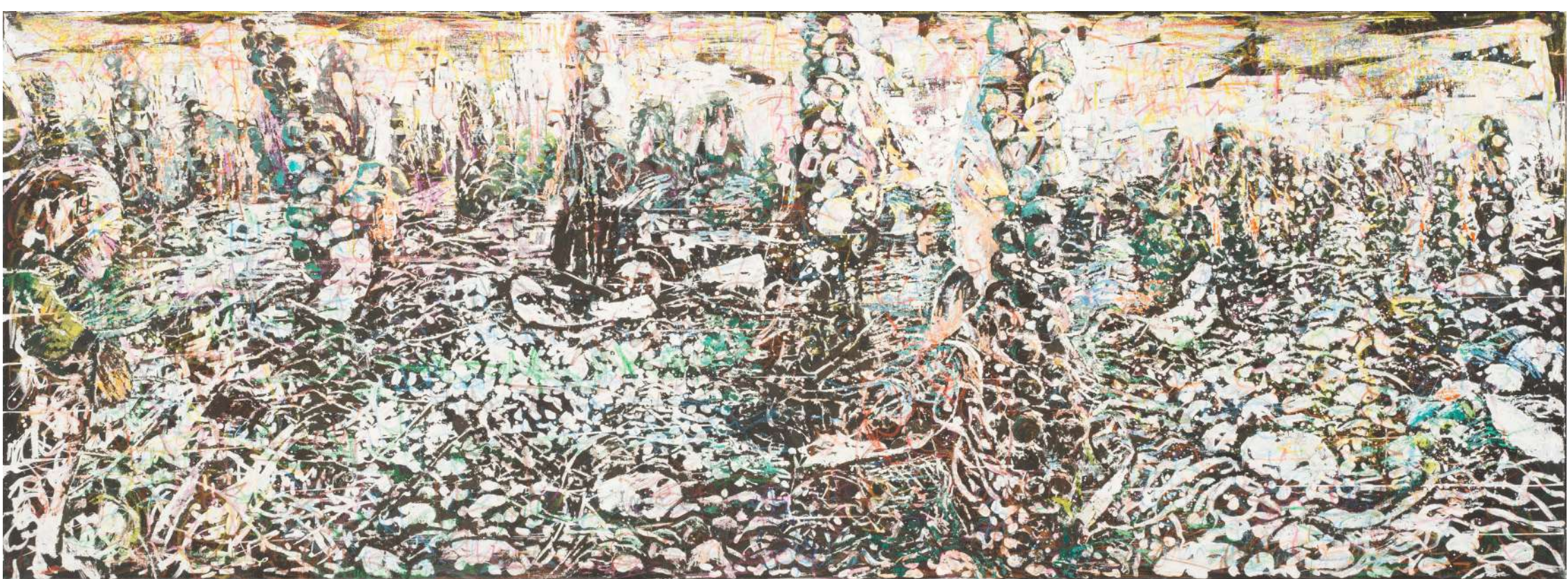
Glave 5, 2023, tuš, voščenka, olje, platno, 90 x 245 cm