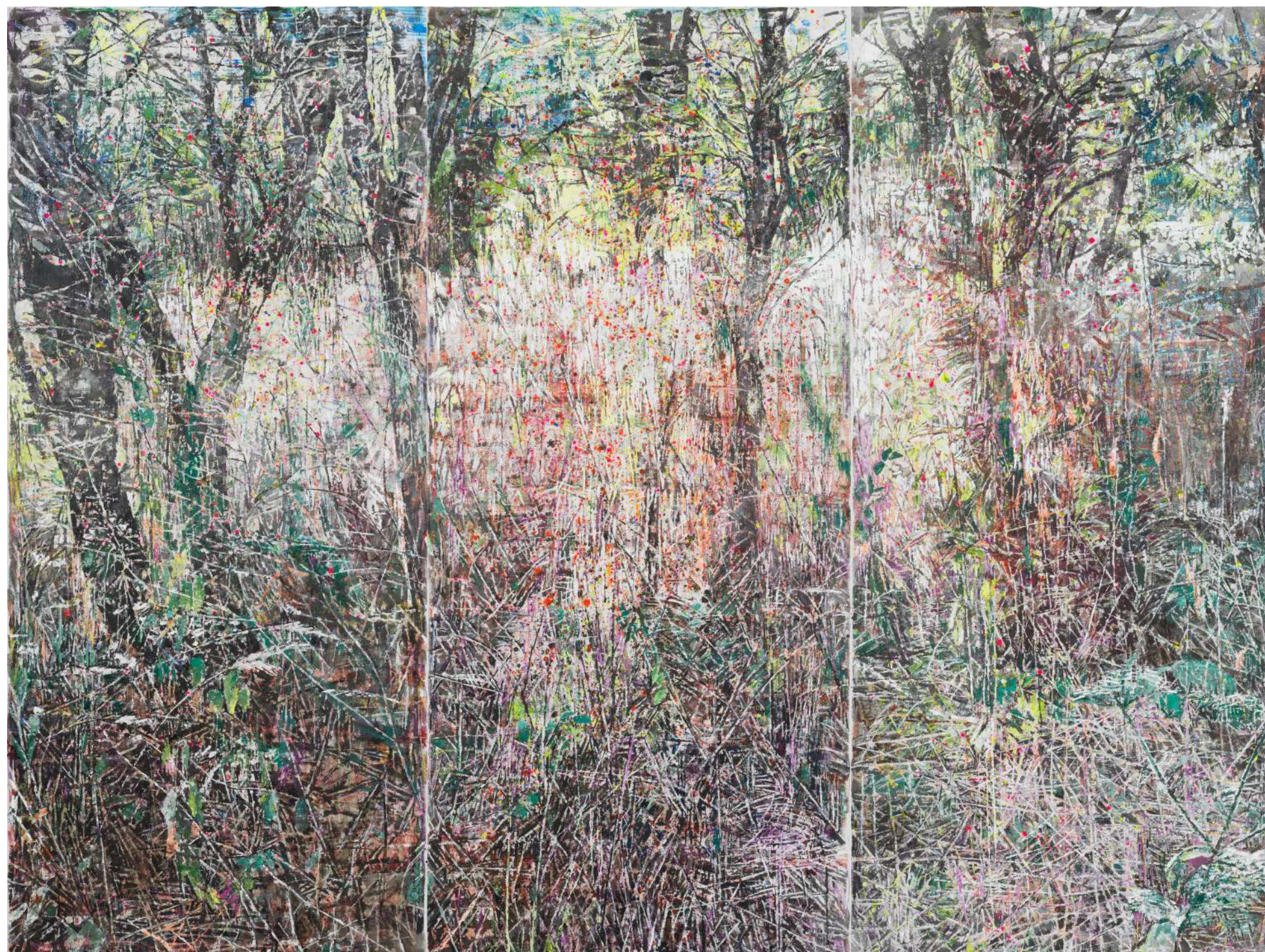
Slivnik 1, 2023, voščenka, akril, tuš, olje, platno, 195 cm x 255 cm