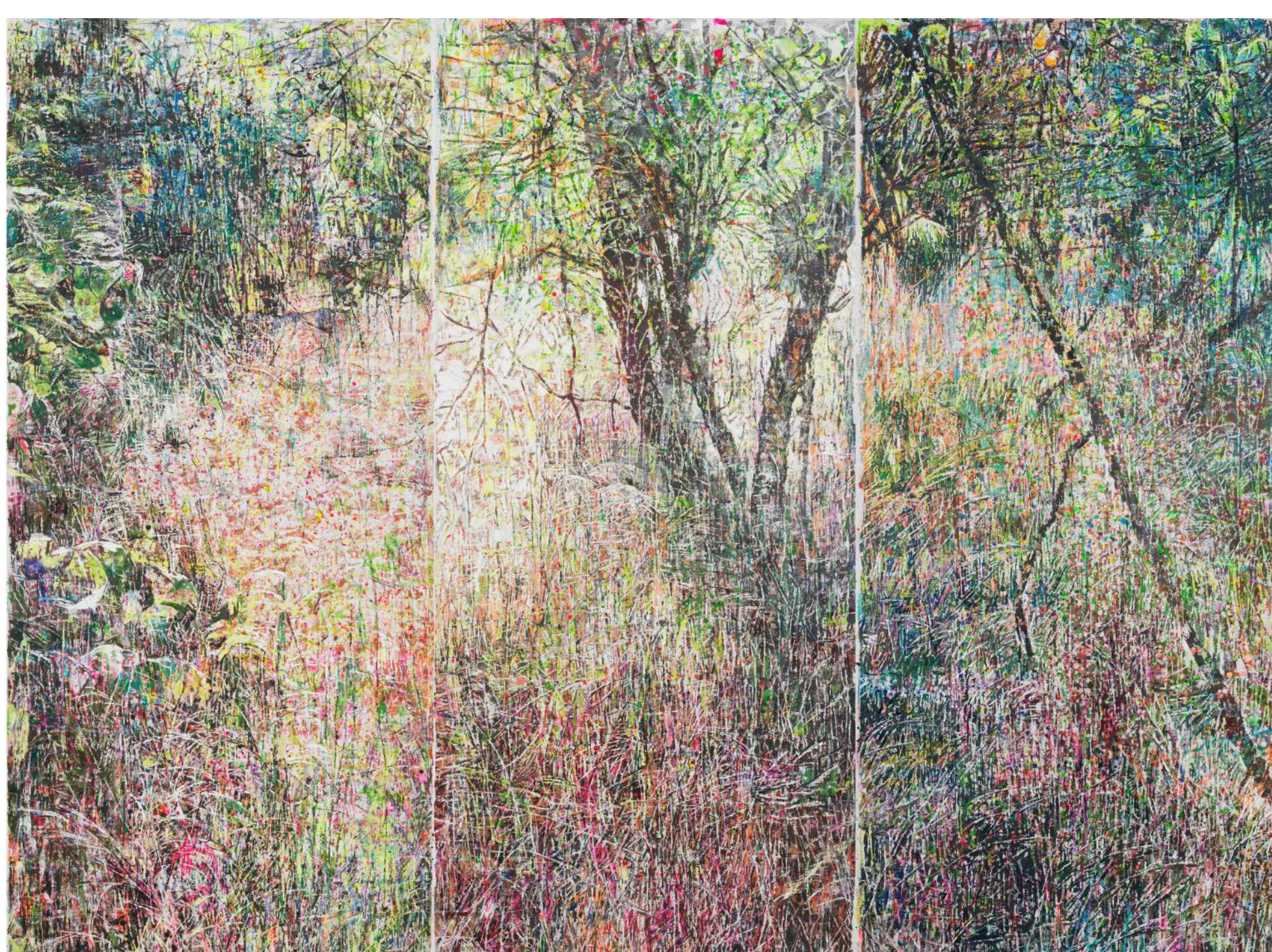
Slivnik 2, 2023, voščenka, akril, tuš, olje, platno, 195 cm x 255 cm