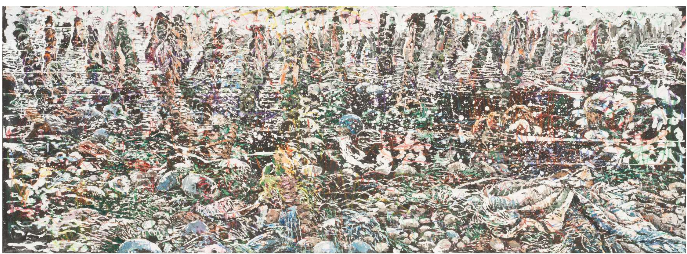
Glave 4, 2023, tuš, voščenka, olje, platno, 90 x 245 cm