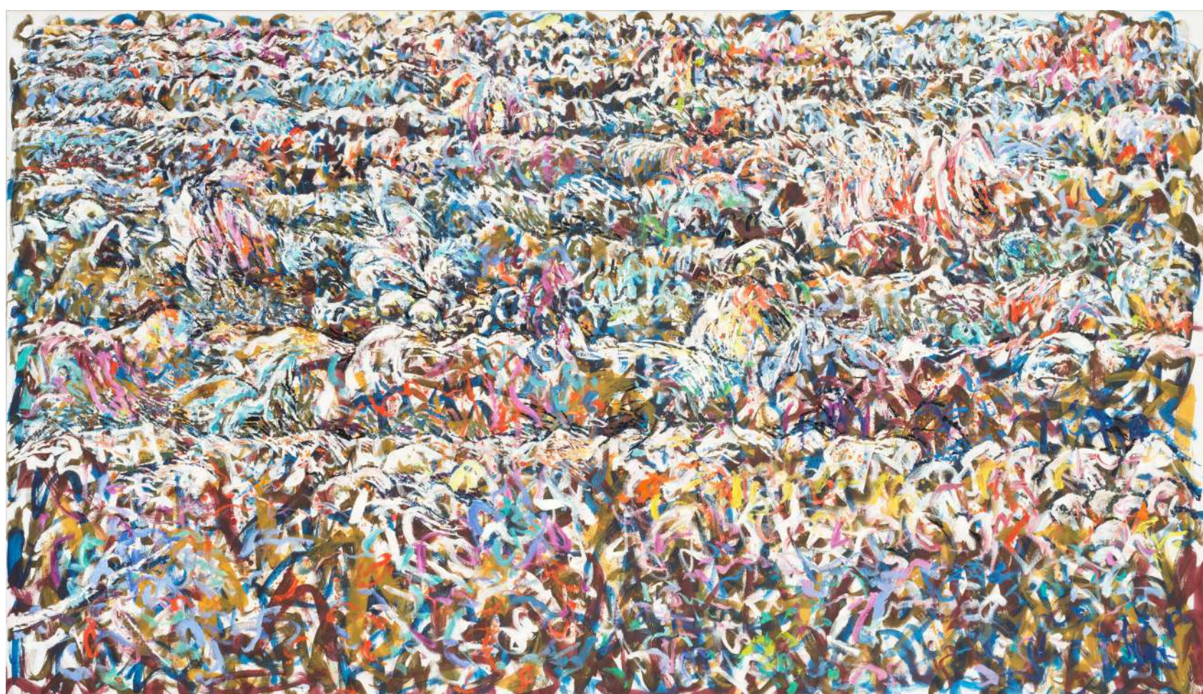
Glave 7, 2024, jajčna tempera, olje, platno, 135 x 230 cm