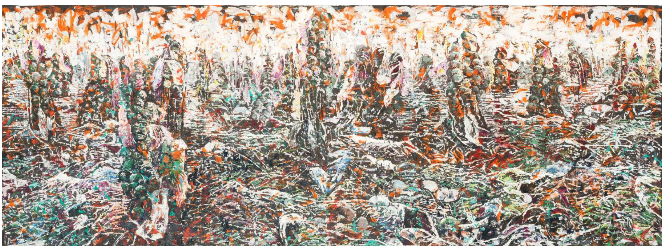
Glave 3, 2023, tuš, voščenka, olje, platno, 90 x 245 cm

Zahvaljujemo se družini Matjaža Gantarja za vso podporo.