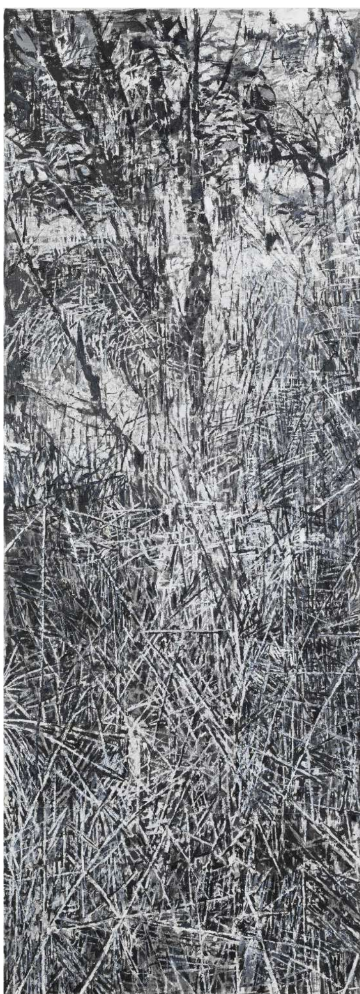
Slivnik 5, 2023, grafit, voščenka, tuš, olje, platno, 205 x 80 cm