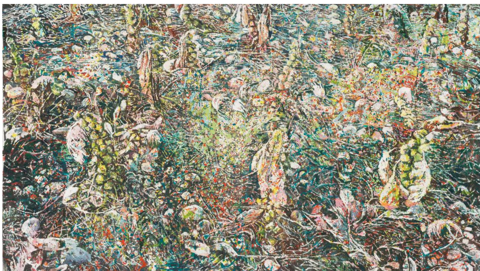
Glave 2, 2023, jajčna tempera, olje, platno, 110 x 195 cm